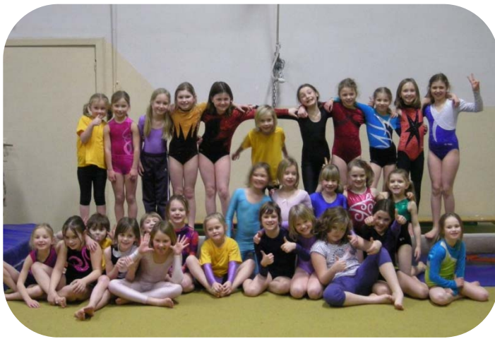
Recr toestelt 1 ste + 2 de + 3 de leerj

De vorige foto's gemist? Kijk op onze website voor het vorige Gymwaasken of het Gym Waasland fotoalbum.