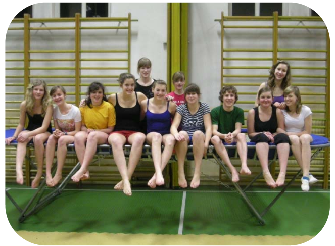
Recr toestelt middelbaar