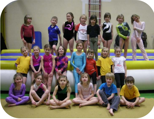
Recr turnen 1 ste + 2 de leerj